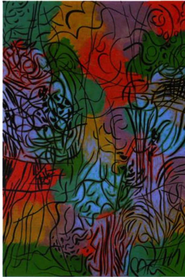
Contrastes , 1998 Encre et acrylique sur papier 112 x 77 cm Collection Musée des beaux-arts de Sherbrooke

Mario Merola n'affirmait-il pas, dans une conférence prononcée en 1974, que « ... la composition d'ensemble se développe à partir d'une grille ouverte. Le support homogène, structuré par l'opposition de lignes de force horizontales et verticales, m'a permis